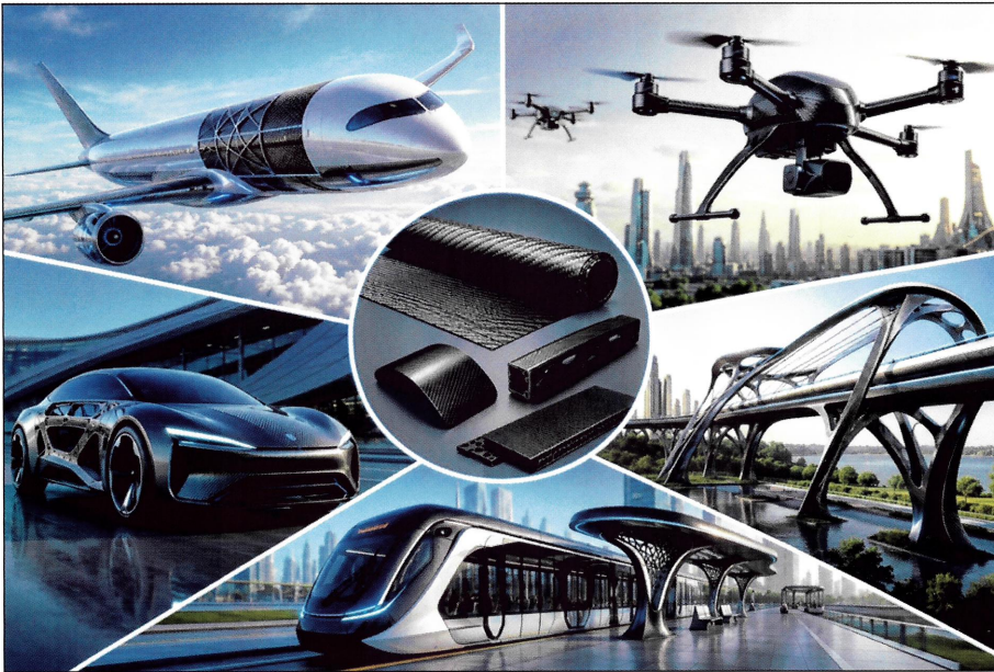
Abbildung 3: Thermoplastische Composites zeigen ein hohes Potenzial für Anwendungen in Wachs- tumsbereichen (made with ChatGPT)

sich die grundsätzlichen mechanischen Eigenschaften auf einen jeweiligen Anwendungszweck ausgerichtet optimieren lassen.